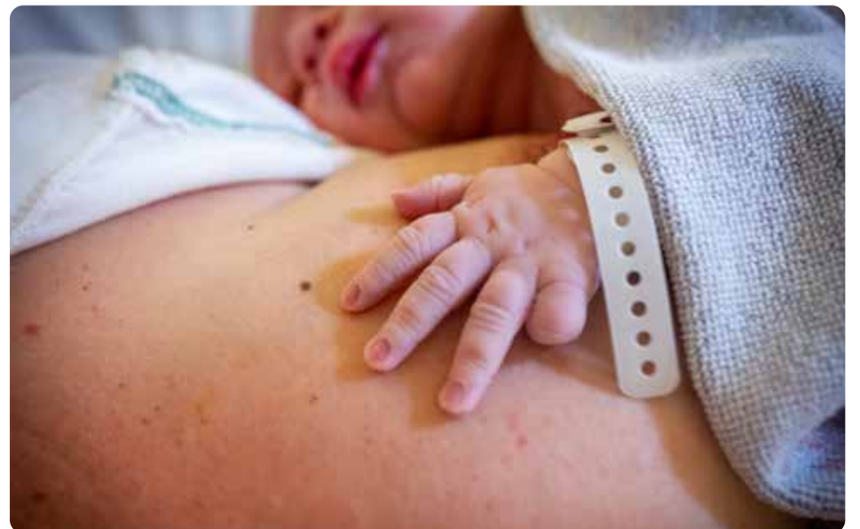
Förlossning. Under 2020 föddes det 18 942 barn i Västra Götalandsregionen.