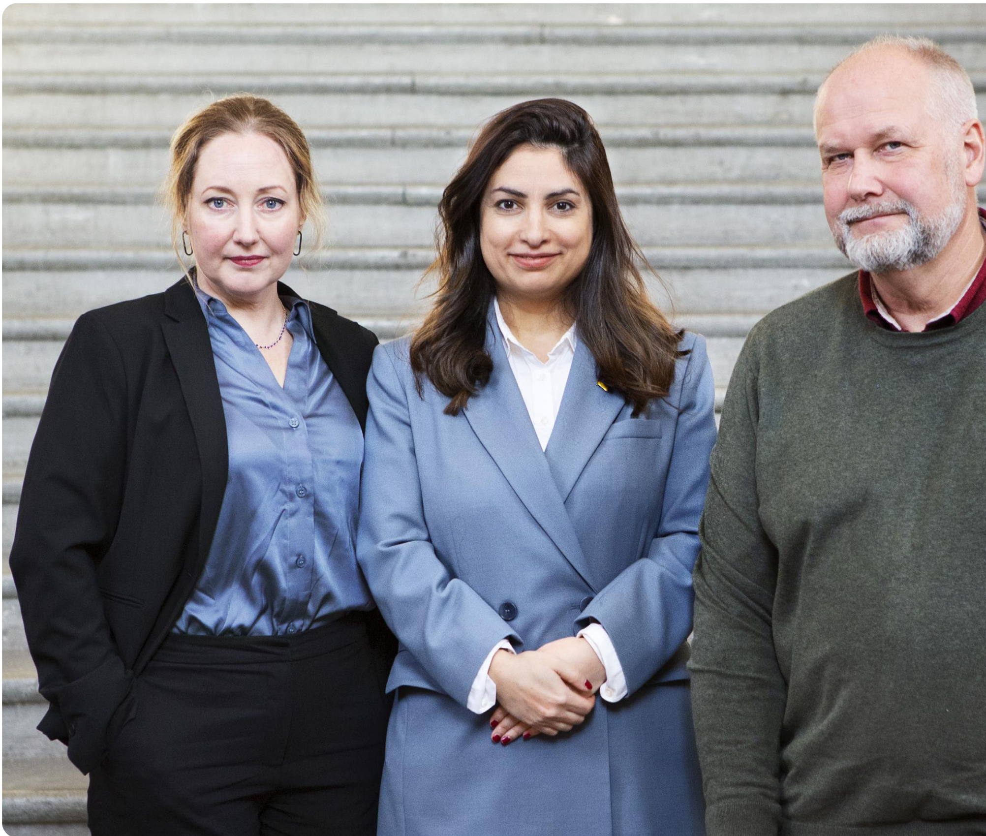
Hanna Gedin, Nooshi Dadgostar och Jonas Sjöstedt vill se ett rödare EU. Hanna och Jonas är Vänsterpartiets toppnamn till EU-parlamentet.

Möt Vänsterpartiets toppkandidater i EU-valet