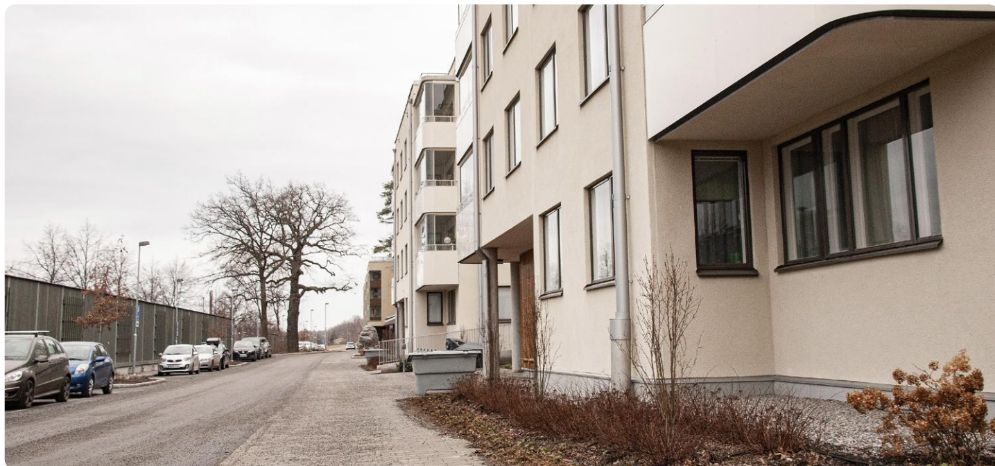
Grönt byggande. I Sverige finns en rad exempel på klimatvänliga projekt som finansierats med lån från Europeiska investeringsbanken, EIB. §