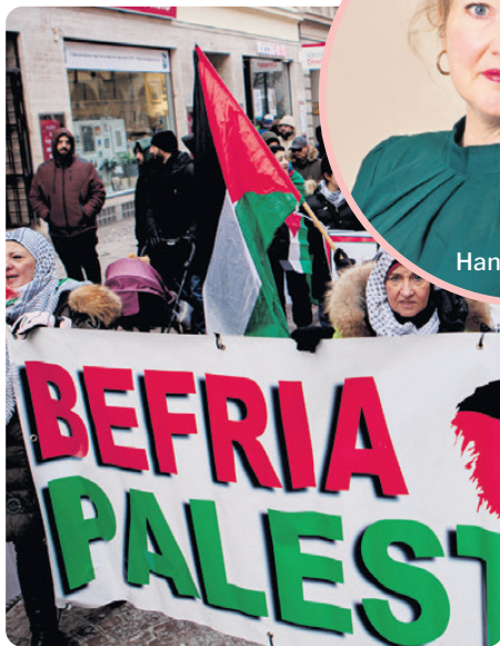
Det finns likheter mellan dagens Palestina-demonstrationer och demonstrationerna för folket i Vietnam på 70-talet.

tiger växer proteststormen. Ibland känns det som om demonstrationstången för Vietnams folk gjort comeback.