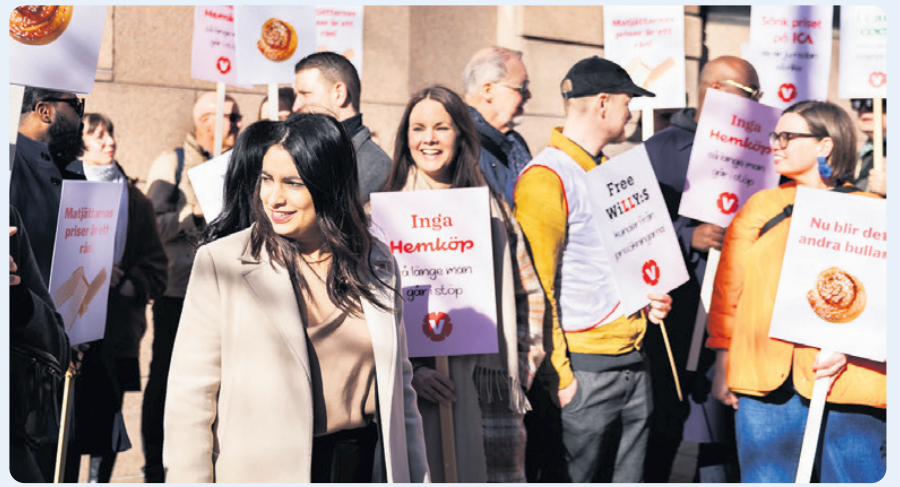
Dadgostar (V) är övertygad om att politiken kan sänka matpriserna. Det har gjorts i Spanien och Frankrike och behöver nu göras i Sverige.

Priserna rusar medan matjättarna gör rekordvinster